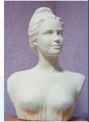
Marianne (salle du Conseil Municipal).