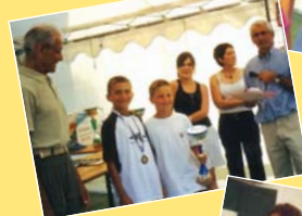
Les jeunes (tableau 1)