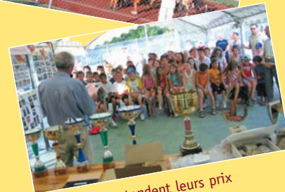
Les enfants attendent leurs prix