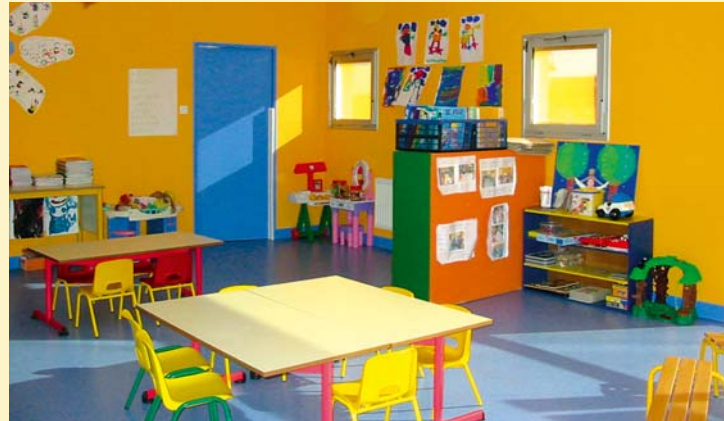
Une des salles de l'école

La clef de voûte de ce dispositif demeure le contrat signé avec la CAF dès le mois de décembre 2001. Déclinées une par une, travaillées avec la CAF, le Conseil Général, la Protection Maternelle et Infantile, les actions et les réalisations sont effectives : restructuration de la garderie scolaire en CLSH périscolaire ; extension du groupe scolaire et réalisation d'un plateau sportif pour les élèves ;