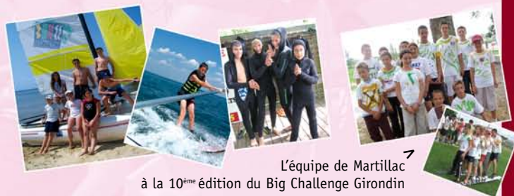
L'équipe de Martillac à la 10 ème édition du Big Challenge Girondin

Les activités de cet été ont permis aux jeunes Martillacais de découvrir des sports aquatiques ou en vogue, et de passer de belles journées en bord de mer.